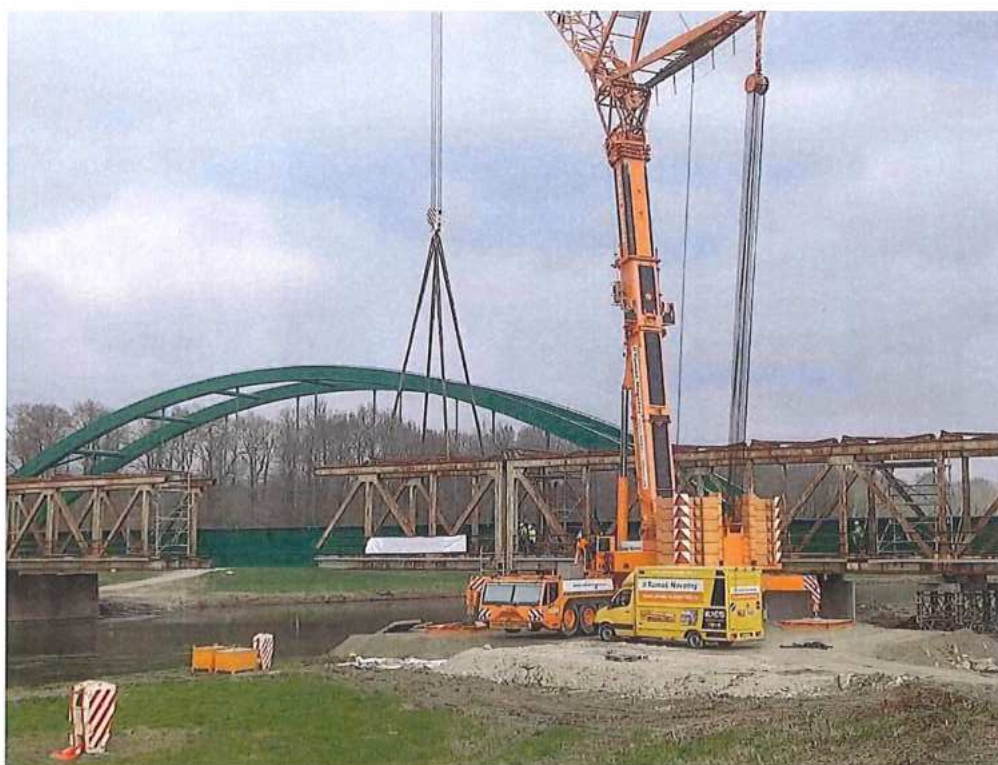
Demontáž OK (hlavné mostné polia) SK strana – SO 12-33-04