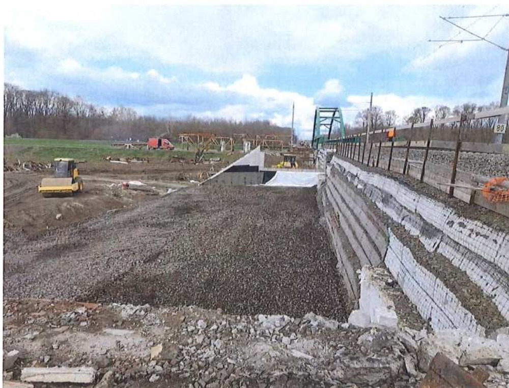
Realizácia násypu – SO 12-32-02