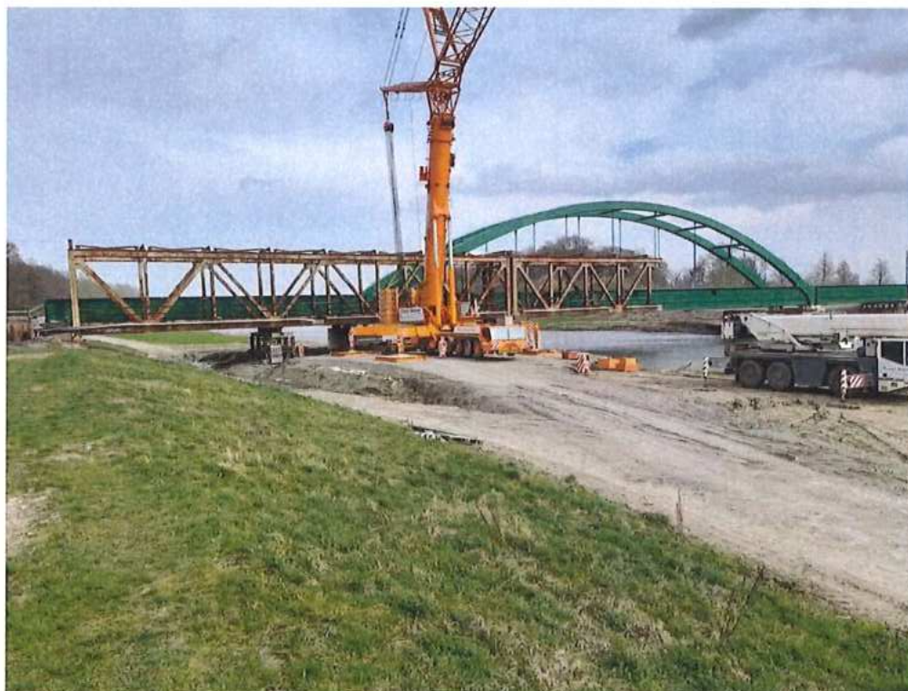
Demontáž OK (hlavné mostné polia) CZ strana – SO 12-33-04