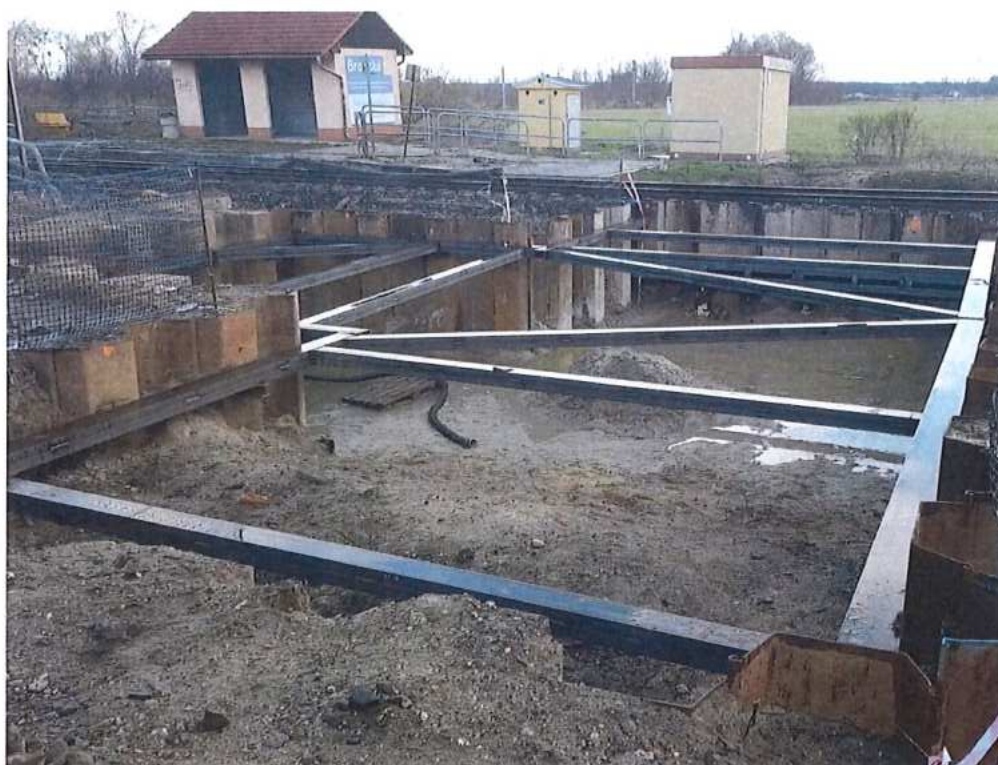
Rozperný rám larsenovej steny v TK 1 – SO 11-33-01