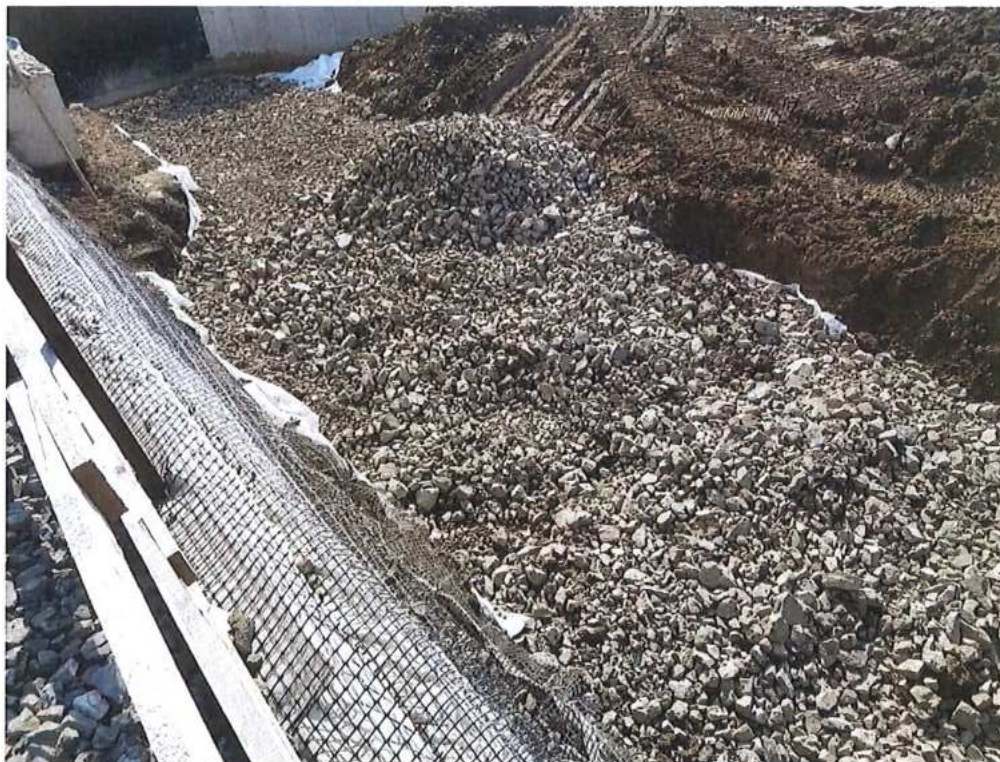
Výmena podložia – SO 12-32-02