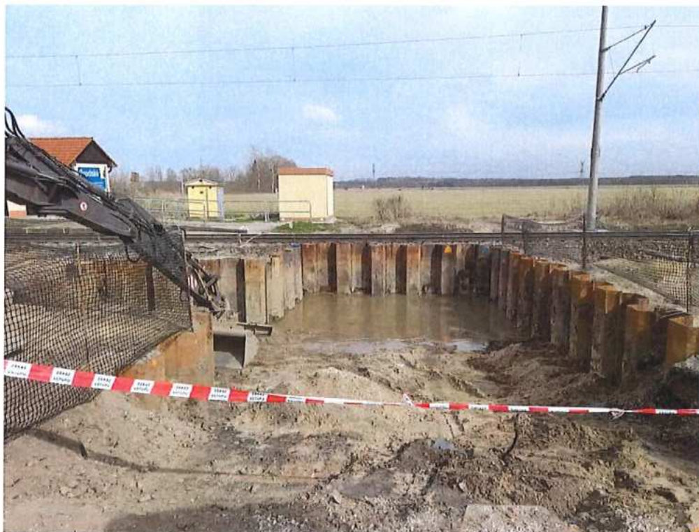
Zemné práce – SO 11-33-01