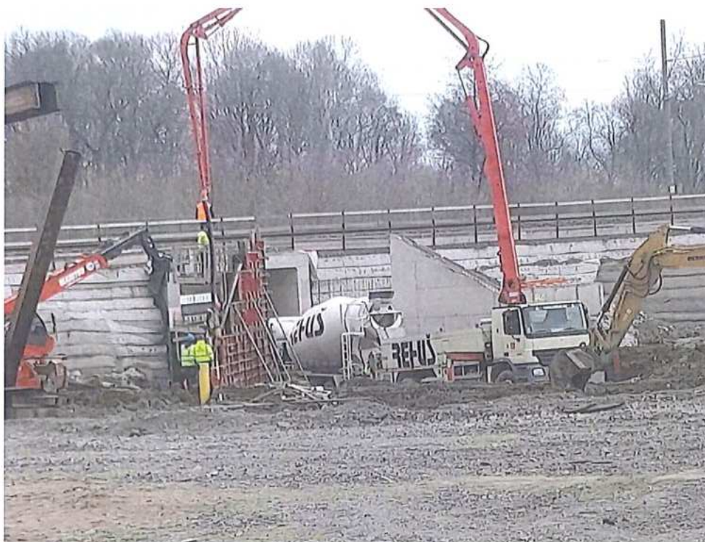
Betonáž krídiel – 2.časť – SO 12-33-03