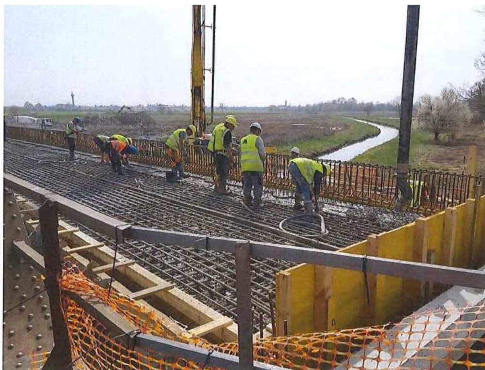
Betonáž hornej dosky – SO 12-33-02