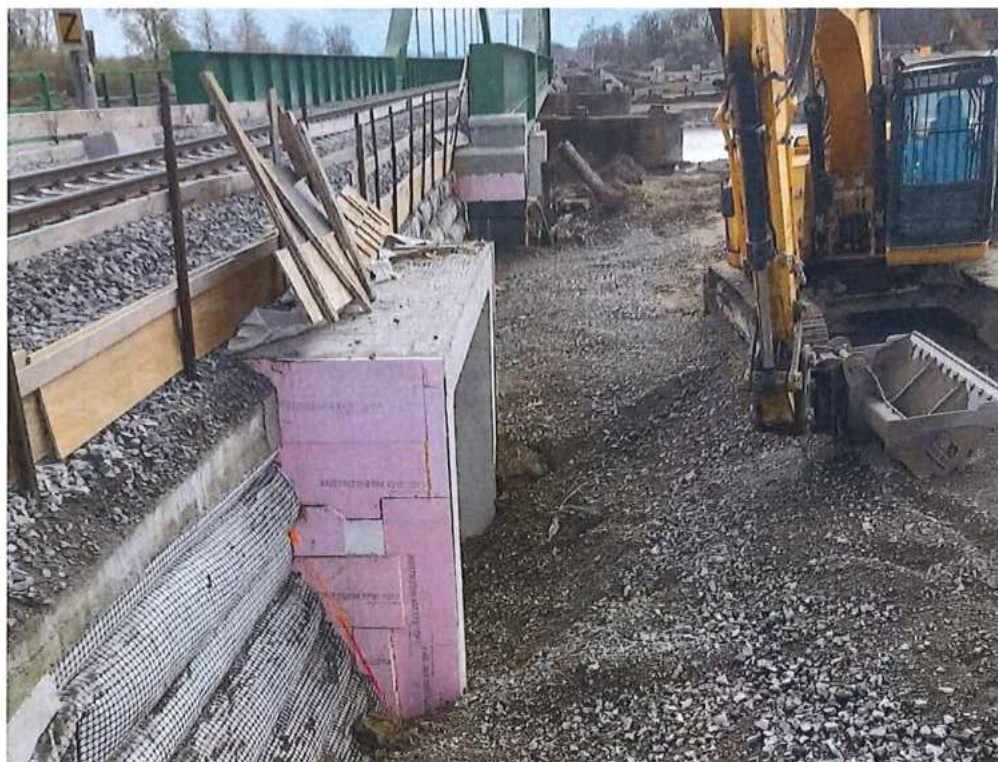
Zemné práce po vytiahnutí larsen – SO 12-33-05 (13-33-02)