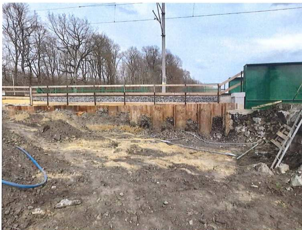
Zemné práce – príprava na vytiahnutie larsen – SO 12-33-05 (13-33-02)