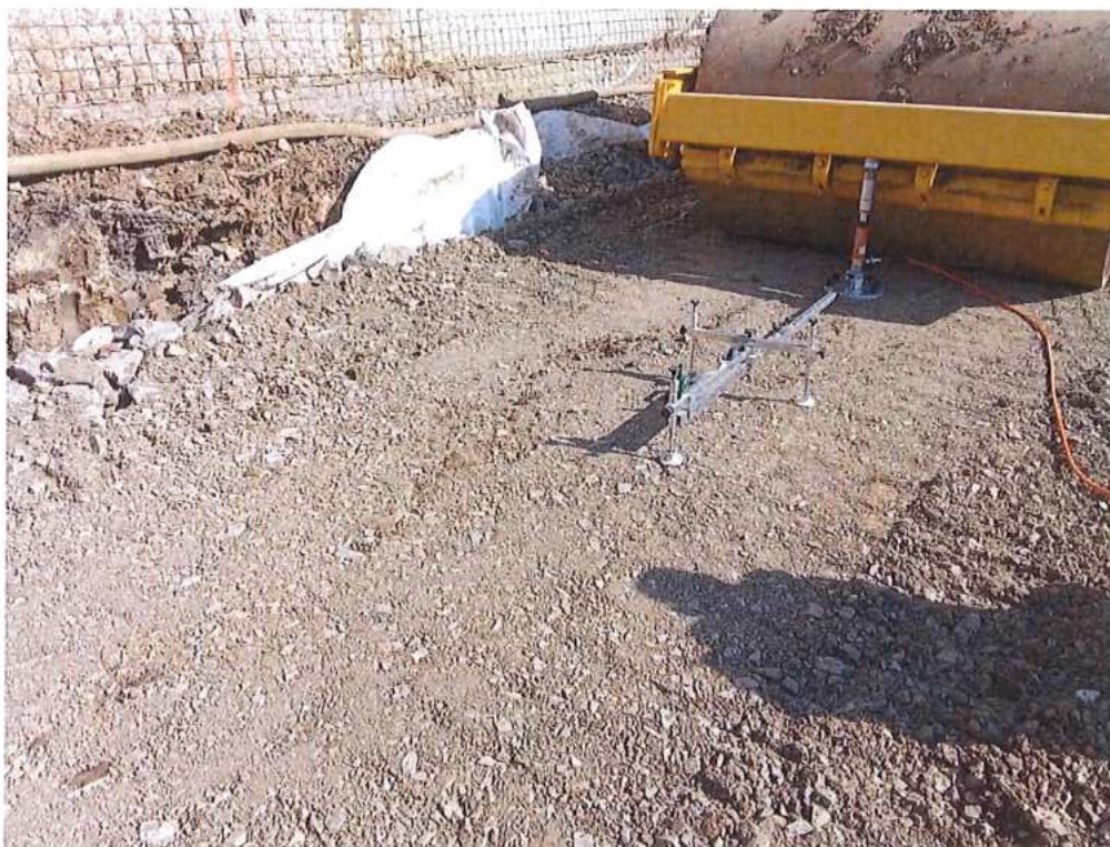
Zaťažovacia skúška podložia – SO 12-32-02