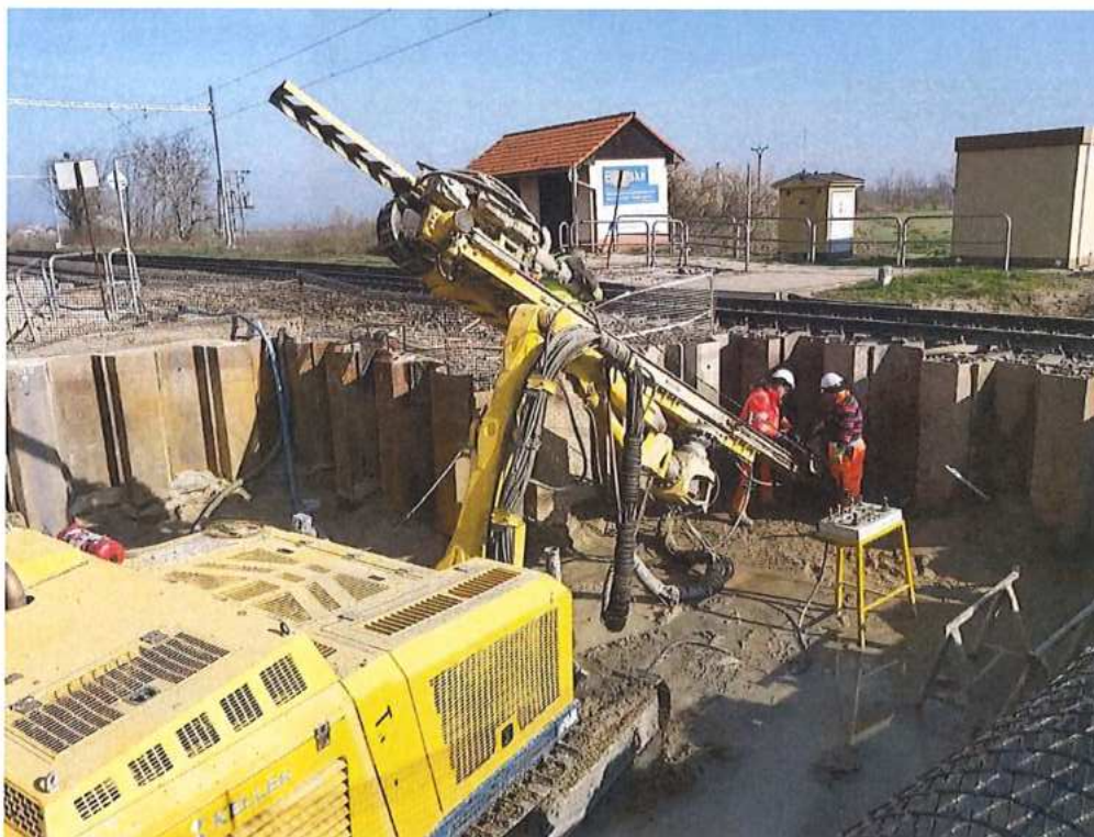
Kotvenie larsenovej steny v TK 1 – SO 11-33-01