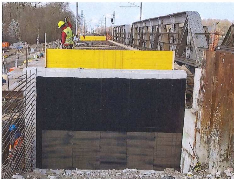
Izolovanie opory – SO 12-33-02