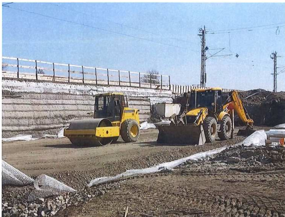
Realizácia násypu – SO 12-32-02