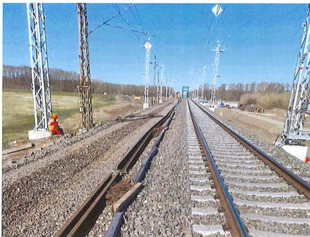
Demontáž žel. zvršku TK 1 v km 73,500 - 74,000 – SO 12-32-01